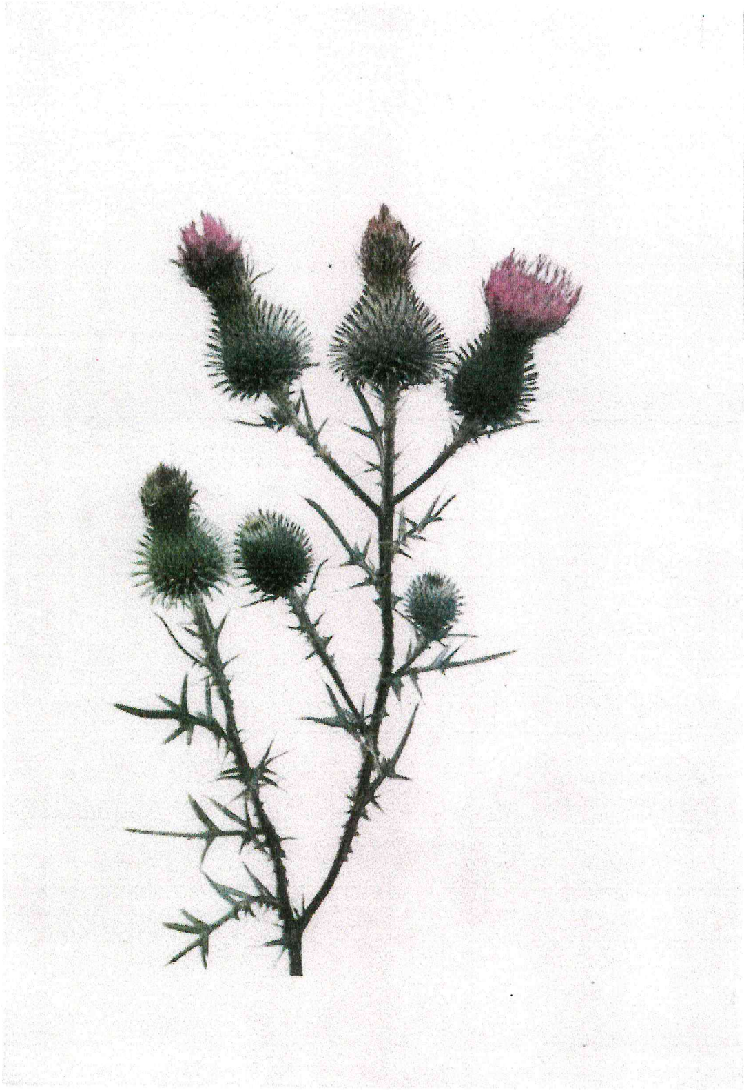
Baum / Jakob – "Kratzdistel", 2013, Courtesy the artists, Foto © David Aebi