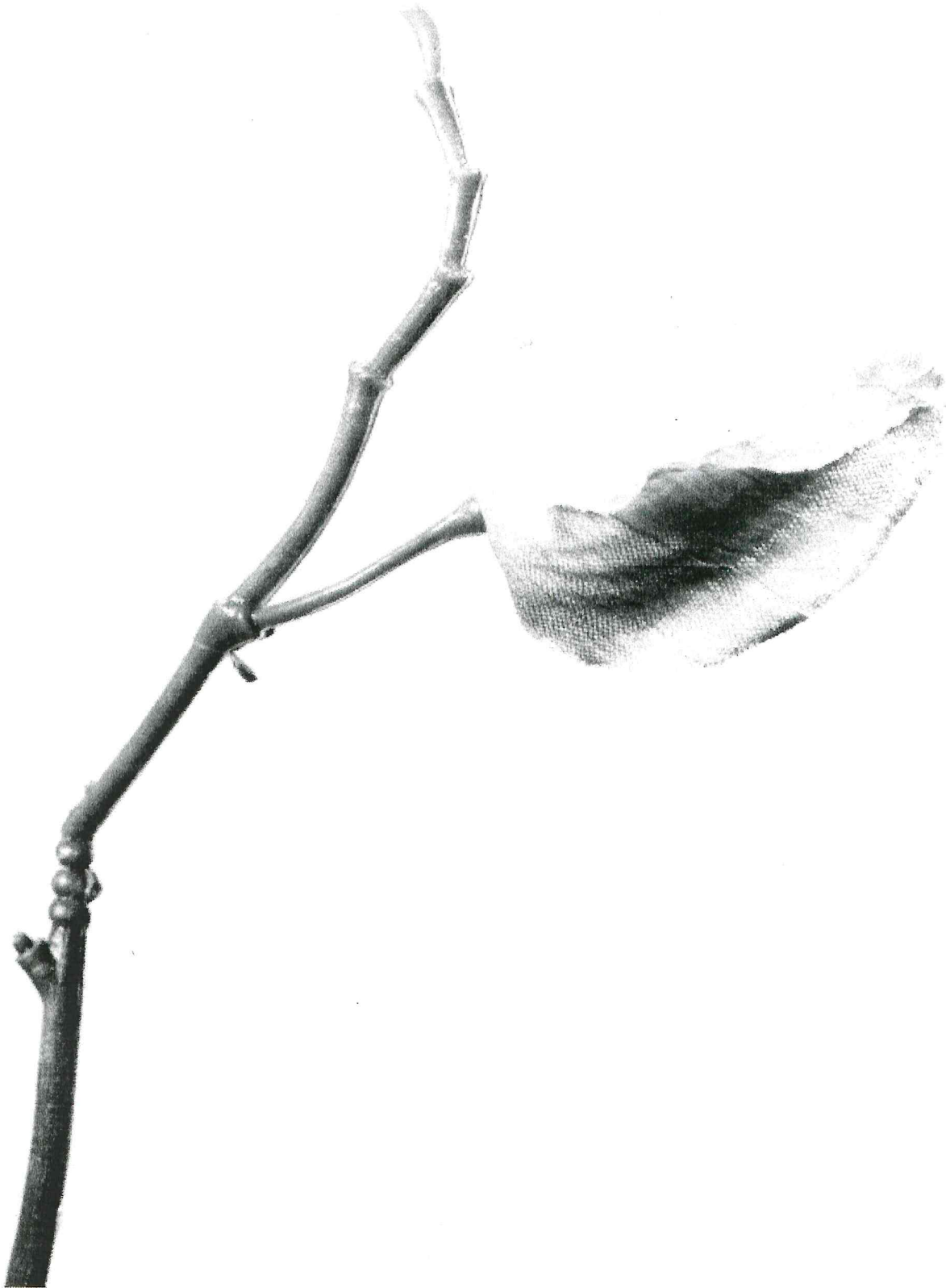
Robert Voit – “Physalis alkekengi, Lampionblume”, 2014, aus der Serie “The Alphabet of New Plants”, Courtesy the artist, Foto © Robert Voit